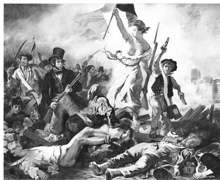
I 自由引導人民油畫

此畫自 1949 年以來再次修復，畫中背景巴黎聖母院上方天空重現明亮的藍天，底下革命者手裡的槍冒出的白色煙霧和空氣中的煙塵更顯清晰。此外還發現一些新細節，例如瑪麗安娜的衣服原本被認為是一致的黃色，但其實是淺灰色帶有一些金色調；畫中右邊拿著手槍的小男孩，其實是在她前方，而非在旁邊。