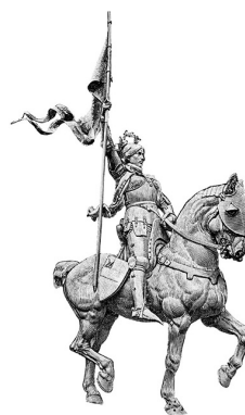
II 聖女貞德鍍金青銅騎馬雕像

雕塑起初遭到嚴厲評價，加上地鐵工程造成的損壞，1899 年弗雷米特暗中用新雕像替換了舊雕像，並為新雕像鍍上了金，以增強其古銅色。貞德戴著象徵勝利的桂冠，穿著盔甲，驕傲地舉著她的旗幟，劍鞘中的寶劍讓人聯想到國家面臨的危險，腳上的馬刺是她騎士身份的標誌。她騎著忠實的駿馬，前往蘭斯參加查理七世的加冕典禮。